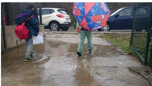
Entrada Alternativa Cicle Infantil ( Es fa servir en cas de pluja)