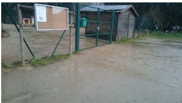
Entrada Cicle Infantil